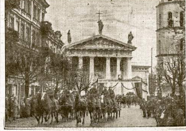
Lietuvos artillerija Vilnyje. Artillerijos dalys pravažiuoja pro Vilniaus katedrą

Kviečiame visus So. Bend ir kitų apielininkų miestelėjų Lietuvos atsilankyti ir gražiai, drąsiskai pareisti subaltos vakarų. Tuom pačiu kartu suteiksite paramos ir padėsite sergamicam draugui perygyventi sunkias dienas. —Rengejau.