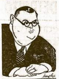
Chamberlaino iekajaus, Finlandijos ulesnio reikalų ministeris Eljas Erko. Padragintas Chamberlaino jis auą dienų išdiegė provokaciją prieš Sovietų Sąjungą. Iš Finlandijos pusės palaisti 7 kanuoles šuviai užsmė 4 raudonarmiėcius ir 9 sunikiai sužeidė.

Didelis ir Maži Vajuininkai. Mes turime smarkių didelę vajuininkų kiekvienoj didesnej kolonijoj, o kaip Chicagoj, tai net keliolika tokių