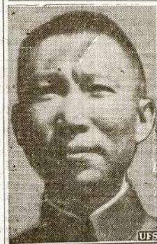
Chinese Defender —General Hsueh Yoh, diminutive Cantonese, who commands Chinese in Hunan province and who directed forces that recently repulsed Japanese attack on 200-mile front.

"They want to establish a reactionary alliance against the working class, against the Soviet Union, the buttress of peace and socialism. They want to use the Scandinavian and Balkan states, and other countries also. For those base aims. These are the real criminal aims of the British and French imperialists, for which they are waging the war."