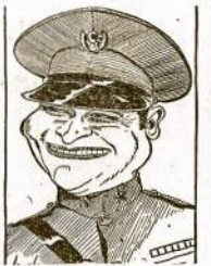
Karikatura buvusio Kubos armijos čyfo Fulgencio Batista. Jis neseniai rezignavo iš karininko vietos, sako, kad galėtų kandidatuoti į prezidentus.

Skaitykite ir Platin- kite Dienraštį 'Viln'!