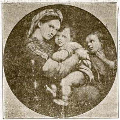
Sis paveikslas, pieštas garsaus Raphael's, ir yra muosa-vybe Italijos. Dabar jis ir daug Italijos kurinių kainuoja net $150,000,000, rodoma Art Institute, Chicagoj.

Ištikro diena buvo kaip pavasarį—šilta ir gražu.