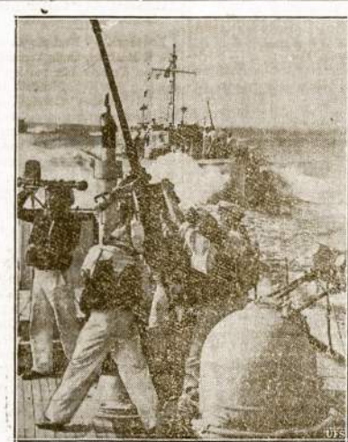
Vokiečių sargybinis laivas šiaurės juroj. Laivas įtaisytas taip, kad daugiau reikią apsigynimui, negu užpuikimui. Svarbiausia tas, kad tokie laivai turi gerai priuikčius anti-orlavinės kanuoles, kuriom apsaugo savus karinius laivus nuo priešų lėktuvų. Panašių laivų jau turi visos kariaujančios šalys.

Montevideo. — Urugvajaus vyriausybė vakar įteikė Anglijai ir Vokietijai atitraus turinio protesto notes, ryšium su įvykusiū anglių ir vokiečių karinių laivų susidūrimu praėtį trečiadienį. Urugvajaus vyriausybė protestuoja pirmą delto, kad susidėrimas įvykęs žiotyje Plate upės, kuri skatolis teritoriaj Urugvajaus sritimi. Antra protestuoja delto, kad anriai laivai plaukiojė "300 mylių neutrališkioj zonoj", kurią prez. Rooseveltui rekomenduojant, nustatė Amerikos valstybių konferencija, įvykusi Panamos Mieste.