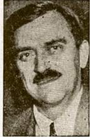
Earl Browder, Komunistų Partijos Generalinis Sekretorius.

Tikietai į Lenino Mirties Paminėjimo Mitingą Iškankto Perkant 30 Centų, Prie Dury 35 Centai. Tikietai Galite Gauti "Vilnyje"