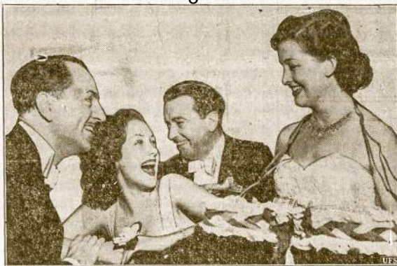
Netiktūmet, bet čia eina pasikalbėjimas apie... Europos karo laisenybes. Tai aų dieną surengta judžių kolonijoj Hollywoode puota, kurios pelnas paskirtas "palengvinti kareivių buklės tranščiose". Skaitant iš kairės: William Powell, Diana Lewis, Richard Barthelmess ir Myrna Loy.