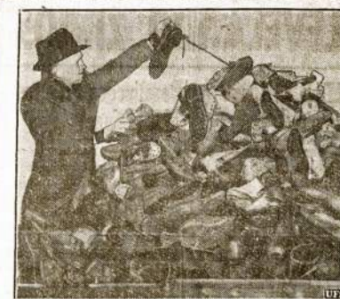
PASAULINIO KARO LIEKANA. Perėję savaitę federale valdžią apšiuirėjo, jog jos sandėliuose tebesauja 50,000 čėvėrykų, kurie buvo nupirkti Amerikos armijai laigantys pasulimlam karui. Dabar valdžia liuos čėvėrykus atiduosanti pašaly administracijai išdėlinimui bedarbiams. Kaip ilgai bedarbiui dėvės virš porą dešėtyk metų sandėliuose išgulėjusius čėvėrykus, tai jau kitas klausimas.