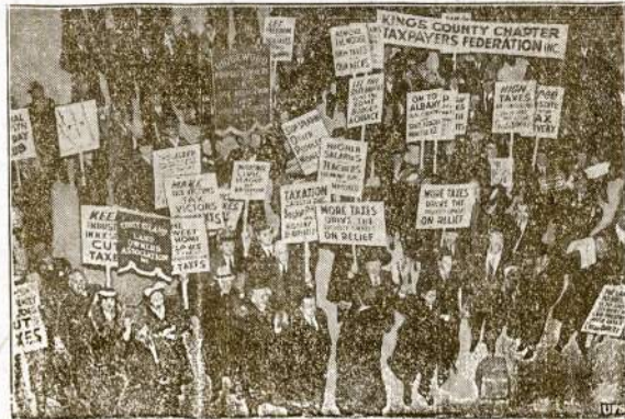
Didelė demonstracija Albany, N. Y., kuri tęsėsi 13 valandų protestui prieš gubernatoriaus nustatytą budžetą. Bedarbiai ir darbininkų organizacijų atstovai protestavo prieš numušimą šalpsnis ir darbanis pinigų, o kiti protestavo prieš įeigų taksų kėlimą.