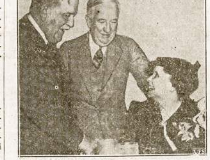
Vienatinė moteris Jungtinių Valstijų senatė, Mrs. Hattie Caraway, Ji jau 63 metų amžiaus ir ilgokai sergo. Bet atsidariusi kongreso sesijai, vistiek sugryžo į Washingtoną ir atvydžiai seka einamas diskusijas, kuriose ir pati dažnai ima dalyvauti. Ji atstovauja Arkansas valstiją. Čia matosi senatorius Smith, iš South Carolina ir kongresmanas Dempsey, iš New Mexico.

Vokietijos kraiciai dabar prisilaiko griežtos ekonomijos. Ten vyrum kelėns siuvamos tik su vienu kišenium. Priežastis to, kad vyrain, ypatinai karieviams, butų liuosnorus rankos atiduoti Hitleriui nazikišk salauti.