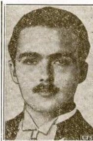
Dar vienas "svetimos valstybės agentas", bet mūsų patriotai nedraudžia jam naudotis pilna laisve Amerikoje. Tai "didysis Austrijos kunigaikštis" Otto Hapsburg, kuris šiom dienom atvyko pasapasuoti amerikiečiam savo "bėdas".

Branzalietai išrašyti įvairiom datom ir duomenim, dabar turinčiom istorinę vertę. Iš tų užrašų išskaityta, kad mirusis galėjęs buti žydų karaliaus Salemono uošvis, o jo motina buvusi garsi karalienė Mut-Nejem. Apskaitoma, kad iškasto turto vertė siekia kelis šimtus milijonų dolerių šių dienų kaina vertinant.