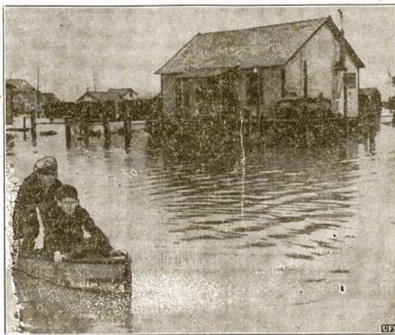
"Patapas" Californijoje. Dideli lietys ir kalnuose sutirpsęs sniegas neseniai taip labai užtvindė Sacramento ir kitas upes Californijoje, kad jų vanduo išsiliejęs iš krantų pridūrė neapsakomai daug nuostolių. Sis atvaizdas nutrauktas Alviso miestely, kai vanduo buvo pasiekęs aukščiausią laipsnį.