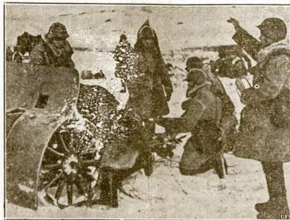
Sovietų kareiviai prie "lauko kanuolės" Suomijoj. Matyti, jie ruošiasi paleisti šūvius, o gal jau šauda. Iš apredalo matote, kad jie nelabai paiso šalčio. Jie gerokai "šildo" priešą iš tos kanuolės.