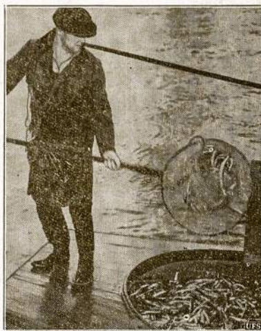
Perdaug žuvelių! Columbia upės žvejai, Washingtono valstijoje, šiemet tiek daug pagauva stintų, kad nebepajėgia visas parduoti. Žvejų unija kreipėsi į federaciją valdžią, kad ji supirktų perviršij žuvų ir išaldintų veltui ledarbiams vietoj pašalpos. Atvaizde matomas žvejys vienu tinklu užmetimu ištraukė 50 svarų tų mažyčių, bet gardžių žuvelių.

Stato LKM Choras Balandžio 7 Školų Svetainėje