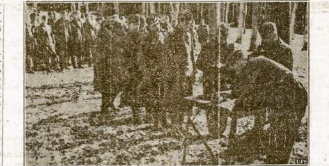
Algos išmokėjimo diena "vakary fronte". Čia matosi burys vokiečių kareivių atsiima algą ir pasirašo čekius. Vokiečiam karveiviam-mokoma po 1 marke į dieną. Tas mažiaud algos vokiečiai turi pasiūsti namo šeimynus iš laikymui.

Vien tik Lorraine miške karveliai perdavę apie 500 laišku. Karveliai mokinami tam tikslui.