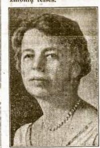
Mrs. Franklin D. Roosevelt

Civilių laisvių savaitės Civie Opera House, prezidento žmona pasakys svarbią prakalbą apie žmoniy teises.