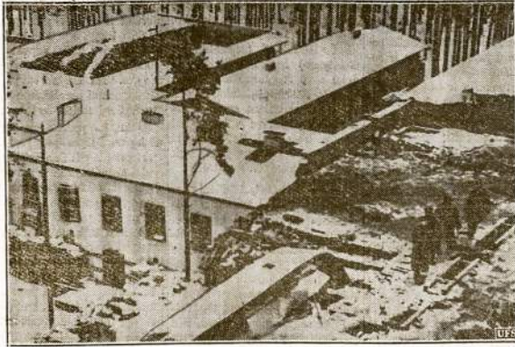
"Baltgardiečiai finai degina Vilorgą pasitraukdami nuo raudonarmiečių", skelbia vi- so pasaulio spauda. Tačiau "pedevodami" šios pavėkslus anglų propagandos minis- terijos agentai skelbia, jog tai esą raudonarmiečių lakunų "barbarizmas".