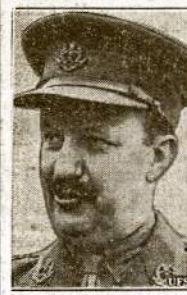
"Pavyzdingas Amerikos patriotas." Tai buvusio mūsų prezidento Theodore Roosevelto silueta Kermit. Jis neseniai atsiėkė Jungtinių Valst. pilietystės ir įstojo Anglijos kariuomenėm. Šiom dienom Kermit Rooseveltas organizuoja kariuomenę Anglijoje, kuriai jis vedovaušias pagelbėti baltagvardiečiam finam.

Kai baronas Mannerheim nuyko į Švediją gegužės 17, 1919 m., tai Stokholmo darbininkai jį apmetė akmenimis ir neleido jam išlipti iš traukinio. Kopenhageno darbininkai irgi akmenimis jį pasitiko. Į kurią Skandinavijos šalį Mannerheim tada bevažiavo, visur gavo akmenų, nes neseniai buvo išskerdęs 30,000 Suomijos darbininkų ir valstiečių.