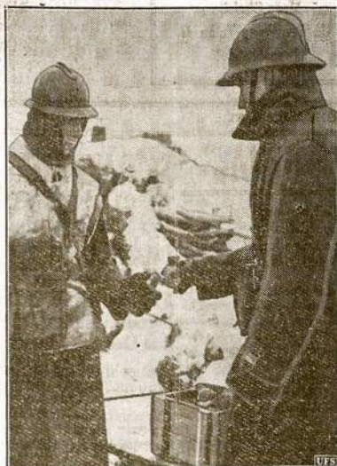
Iteikia munešti "lauktuvių". Francuzas leitenantas iteikla glėbį rankinių granatų kariuovii pasipindimas jį patrubio pareigom. Jei buti galima ant sykiu matyti kas dedasi kitai pusej tvirtoviu, tai pasrodytu, jog vokiečiai tokias pat "vaisės" ruošia francuzom. O betgi jie jokio piktnimo neturi vieni prieš kitus.

Darbo inspekcijoje įregistruota apie 100 pramonės įmonių, veikiančių vien tik Vilniaus mieste.