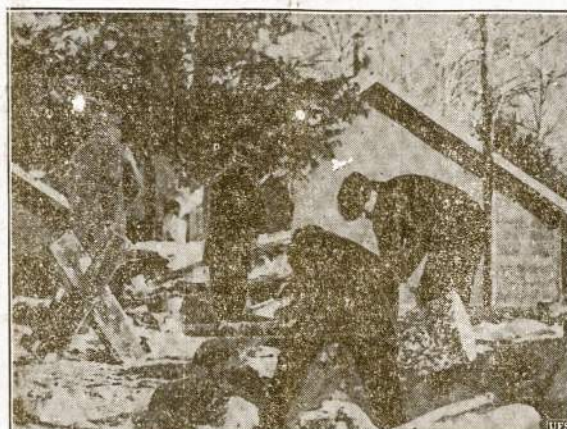
Tai vokiečių kempė Kanadoje. Kanados valdžia įsteigus tris tokias "svetimąlių priešų" kempes, nes Anglija kariuotį su Vokietija. Kanada gi yra Anglijos Dominija, tai ir ją vokiečiai yra priešai.

Karas tarp Vokietijos ir Allan-ty pilnam nuogume stovi kaipo imperialistinis karas—už pa-saulio persidalinimą. —V. Andrusis.