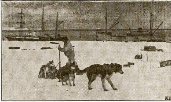
Įsaiusi admirolo Byrd ekspedicija Pietinio Ašigalio srityje. Toliau nuo šios vietos jau nebegalima plaukti laivais, dėlto ekspedicijai nariai išsiskrauna provizijas ir kiukosi šunis tėti kelionę po laius link rogutėm.

Bet Metelionis šitą sumą paėmęs padalina ant pilno nario mokesties sumos, būtent, 40 centų. Taip padalinus, tai suprantama, įsiai būtina turi sirasti ne šesis narius, o 4½ ir kitam atsitikime dar smulkesnį skaičių. Bet