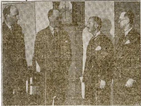
Gal tik po 20 metų sužinosime ką šie dženelmanai skymuoja. Tai mūsų prezidento "priešais ambasadorius" Sumner Welles lankosi Chamberlaino rezidencijoje. Skaitant iš kairės: Anglijos ušienio reikalų ministras Halifax, Sumner Welles, Chamberlain ir mūsų ambasadorius Anglijai Kennedy.