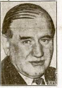
Edouard Daladier, buvęs Francijos premieras, kurio ministerijai parlamentas nuvertė. Jis panaikino laisvę, pasiėmė sau diktatorišką galią, išmesdamas iš parlamento komunistus. Jis 300 parlamento narių pagalius išreiškė jo valdžiai nepasitikėjimą, nebalsuodami už jį.

Turkija, sakoma, jau pradėjo derybas su Sovietų Sąjunga. Turku mano, kad Suomijoj karui pasibaigus išvyko barieras, kuris neleidė Anglijai pagerinti santykius su Sovietais.