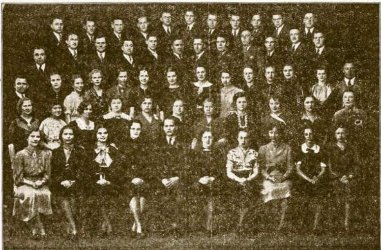
ROSELANDO DARBININKŲ AIDO CHORAS

ASHLAND BLVD. AUDITORIUM Ashland Boulevard ir Van Buren