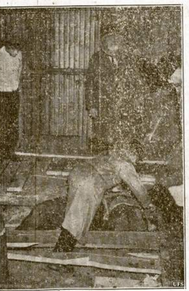
Sėptyni vyrai ir dvi moters, visi benami, įsiekdami pastogės nuo lietaus, palindo po vaisių sandėliu, Santa Rosa, Kalifornijoj. Tuo tarpu grindys lūžo po 270 tonų sunkumų prikurtų slyvų ir sutrynė visus. Jų lavonai išimtinėjama iš grūvisių.

New York. — Saulės taškai vėl stipriai paveikė į mūsų žie-mės radio komunikaciją. Jie, atliekė čia 90 milijonų mylių vėl nukrito radio ir telefono susisie-kimus tulam laikui.