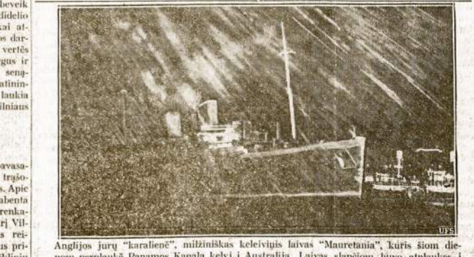
Anglijos jūrų "karalienė", milžiniškas keleivinis laivas "Mauretania", kuris šiom dienom perplaukė Panamos Kanalų kelyj į Australiją. Laivas slėpimo būvo atplaukęs į New Yorką ir čia permaliavotas tamsia spalva taip jau slėpimo išleido pavojingon kelionēn.