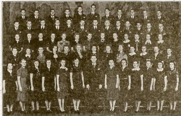
L.K.M. CHORAS—OPERETES PERSTATYTOJAS

Tikietai: Išanksto: 85c Prie Durų $1.00 Šokiai Abiejose Svetainėse