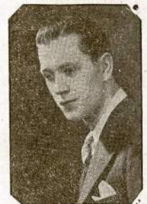
A. GARSINSKAS "Karalius Louis XI"