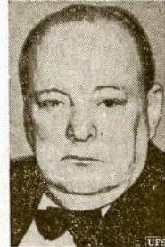
Winston Churchill, kuris norėjo uolesnio karo vedimo ir kylant reikalavimam pirmiau Anglijos valdžioje, liko iškeltas į aukščiausią karo spėkų komandą. Dabar jau yra visos progos aštriau karą vesti vokiečiam užimtus Daniją ir imant Norvegiją.

Londonas. — Tarp Anglijos ir Olandijos pasaziernių orlaivių lėkiojimas sulaukintas, bent laikinai.