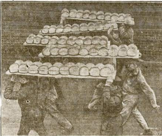
"Duonos mūsų visų dienų... Gal taip poterūja šie Anglijos kareiviai nėsdamiesi diening duonos porciją į apkasus "kar nora va-karų fronte". Kai milijonai kareivių šeriami karu fronte be jokio naudingo darbo, tai civiliam gyventojam, ir dirbantiem sunkius darbus, duonos kiekis vis labiau mažinamas.