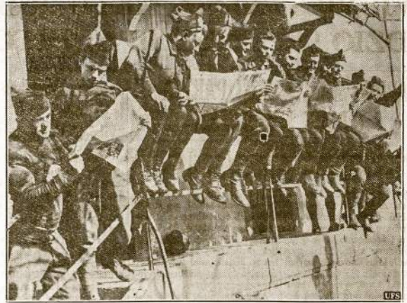
Francuzai kareiviai fronte skaito karo ministerijos perkoštas "žinias". Pati vyriausybė jem leidžia laikraščių užvardint "Je Pique". Iš lauko laikraščiai į frontų neleidziami.