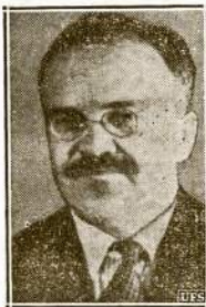
Vėceslav Molotov, Sovietų premieras ir užsienio reikalų komisaras, kuris priėmė Vokietijos ambasadorių ir ilgokai su juo kalbėjosi ryšium su Vokietijos ir Anglijos karo žygiais Skandinavijoje.