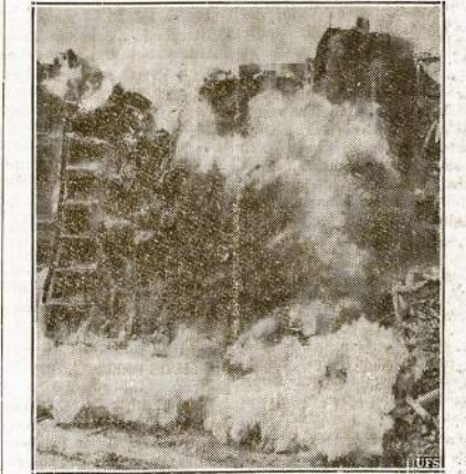
Panašiai kaip Europos kare. Aną dieną dimnitu nūgrautas 9 aukštų murinis butinkas Washingtono, kas padaryti vietos naujam karu ministerijos pastatui. Kuris nežinojo kas atsitiko, išgrėdė eksploziją gal pamatė, kad ir musy sostinė atlaukė nelaukti "paukščiai", bombiniai lėktuvai.