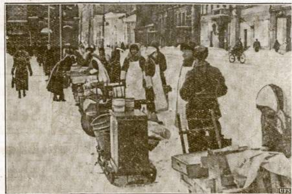
Helsinkis ateina į normales būvas. Prasižėvus finų baltgvardiečių karui su SSSR, daugelis Finlandijos sostinės gventojų buvo varu varomai į provinciją. Dabar jie jau grįžta atgal prie kasdieninio užsiėmimo.

Seimininkė buvo žmoniškis jausmų. Ji nutarė Pranelį laikyti kaip savo sūnų. Prisakė merginoms tuojau pašildyti vandenio, pripilti bakčią ir Pranelį numaudyti, galvutę gerai išplauti, sulepti su nesudytj sviestu, paskni apvilkiti švairiais marškiniiais ir pagal miery apsiaustu, kuris bu-