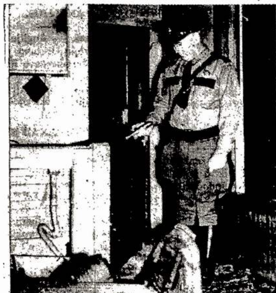
Valstijos policistas daro investigaciją kambaryj, kuris puseitina apgraiutas, kada jame buvo užsibarikavę “Jahovos Liūdininkų” (religinės sekto) išpažintojai. Tas atsitiko Kennebunk, Maine, kada miestelio gyventojai juos užpuolė šiame name. Ši sekta griežtai atsisako salutuoti Amerikos vėliavą. Ankščiau J. V. Teismas išnešė sprendimą, kad salutavimas vėliavos privalomas visiems. “Jahovistai” teisinasi, kad jų religija tai daryti nepavelijanti.

Kaunas (Ela). — Dėl šio karo praėjusį rudenį musų prekybos laivynui netekus dviejų pačių didžiųjų prekybos laivų “Kauno” ir “Panevėžio.” Baltijos Lloydas, kuris tiesioginiai rūpinasi musų prekybos laivynu, nesenai vieną naują prekybos laivą įsigijo Amerikoje. Dabar tenka patirti, kad vedamos derybės įsigyti dar vieną prekybos laivą.