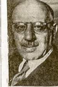
Joseph A. C. Avenol, buvusis Tauty Lygos sekretorius. Aš dieną jis paskelbė pasauli savo rezignaciją iš tų pareigų, nes nebėliko kam sekretoriauti.