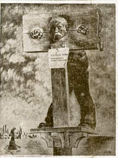
Amerikos Lyga Gynimui Ateivių Teisų išleido brošūrą, kurioje neparpuo aštrumu kritikuoja nepiliečių registravimą ir pirštų antspaudų ėmimą. Ant brošūrarės pirmo puslapio uždėta viršuj matomas piešinys.