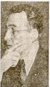
Socialės Apdraudus akto vykintojas, Social Security Board pirmininkas Arthur J. Altmeyer.