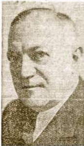
New Yorko senatorius Robert F. Wagner, kuris neseniai įnešė kongrese pasiūlymą praplati socialės apdraudus aktą, kad juomi būtų apdrausti dar 10,000,000 darbininkų, kurie šiame laiku neturi jokios valdiškos apdraudos.