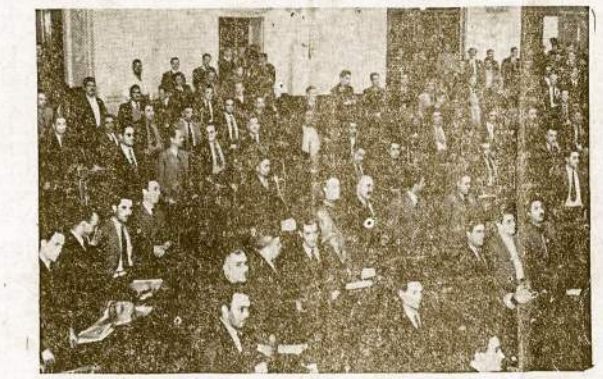
Meksikos seimas posėdy. Iš 142 naujai išrinktų atstovų 110 eina su dabartiniu prezidentu Cardenas ir naujai išrinktu prezidentu Camacho.