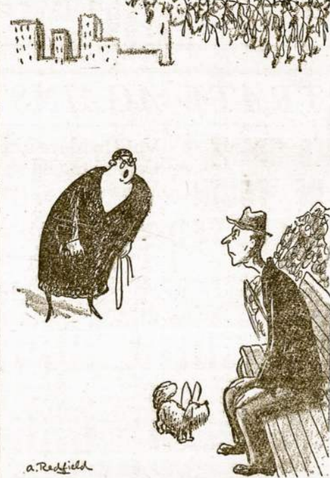
"Come away from there, Fifi—you might catch something."