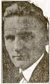
Senatorius Gerald Nye

Pamatykite ir supraskite svarbą šio Kongreso. Be didelio aiškumo šiandien kiekvienam pastebima, kad mūsų šalies vyriausybė žmonės dala pastangas Ameriką priartinti prie karo. Tas daroma: per konskripciją, per ateivių registravimą, per varžymą civilių laisvių.