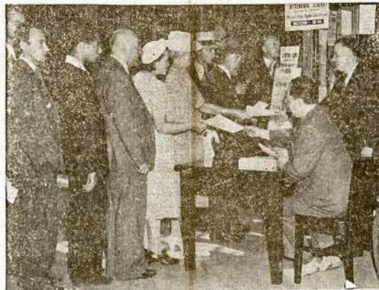
Ateiviai nepiliečiai, New Yorke, stovi eilėje, kad smulkmeniška pasakyti apie save ir palikti pirštų nuotraukas.