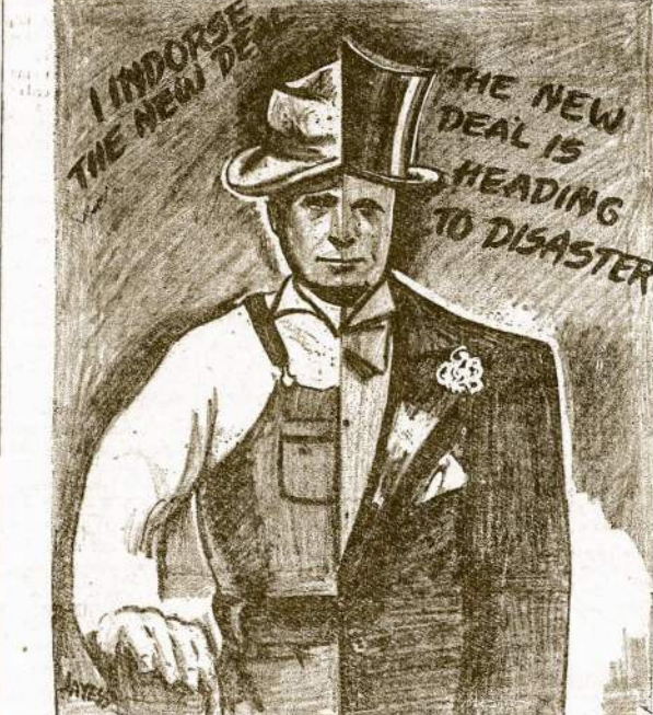
"Dubeltavasis" republikonų prezidentinis kandidatas Wendell Willkie. Vienu pusę jo apsvikūli darbiniais drabužiais ir stvoja už "naująjį dalybą" Amerikos laudžia. Gi kitąjį pusę praktiska viską kas pažan gaus ir indoruoja demokratų administracijos karinę isteriką.

Vokiečiai dabar itin svarbu Rumunijos nafta. Juk Vokietija sintetiskai (dirbtinu būdu) pasigamina apie 3 milijonus tonų metlams, išveža tik 20% tos naftos, kurią gaudoavo iš Amerikos, Irako