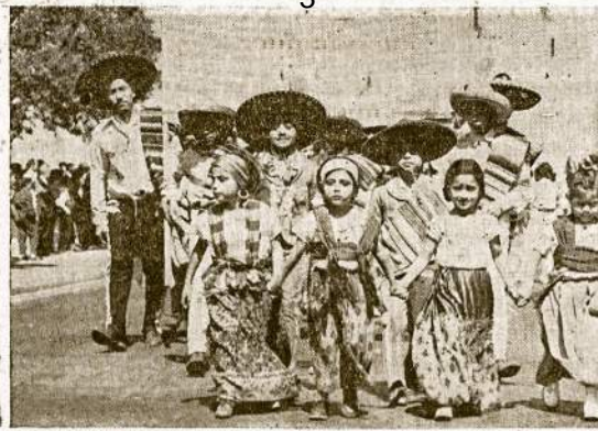
Mūsų kaimynai iš "anapus pietinės sienos." Būrys meksikiečių San Francisco parodoje dramatižuoja kaip dvi kaimyniškos tautos gali draugiškai sugyventi, žinoma, jei ne aliejaus magnatų ir didžiųjų žemvaldžių intrigos abiejose sienose pusėse.

Prašome visus "Vilnius" skaitytojus pirkti sau reikalingus daiktus pas tuos biznierių, kurie garsinasi "Vilny" ir kurie remia "Vilni".