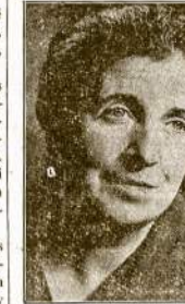
Elizabeth Gurley Flynn

Visi, o ypatinai moterys neturėty patiekti progos išgirsti Elizabeth Gurley Flynn, geriausia iš Amerikos motery kalbėtojų.