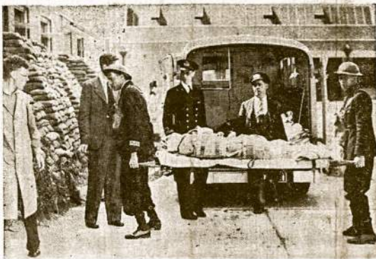
Londono sanitarai rūpinasi sužeistaisiais.

Republikoni laikmėję Mainė veltuoj, tai labai smarkiauja. Jų čutuzimas tačiau yra per daug nuodotas. Pagalios, juk Mainė