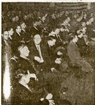
New Yorke laikė susirinkimą europinių kraštų jūreiviai, kurie išrinko platų komitetą veikti prieš prekybinį laivų savininkus, kurie paneigė Europos jūreivius. Susirinkimas buvęs skaitlingas, jūreiviai pasisakė kovos už savo reikalus.