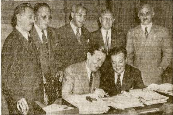
Viduryje sėdi (šviesiu švarku) seniau buvęs New Yorko majoras James J. Walker, paskirtas naujom pataligom su metine alga $20,000. Jam pavesta prezidento pareigos Cook and Suit Co.