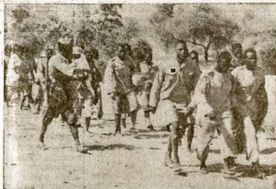
Kada Anglijos kariuomenė apėjo Somalilandą, užėmus Italijos kariuomenė suėmė šiuos tu krašto kareivius, kurie tarnavo Anglijos kariuomenėj. Jie matosi varomi į koncentracijos kempę.