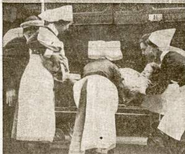
Kaip dabar Londonas bombarduojamas susidaro pavojus ir ligoninėse esantiems. Paskutiniu laiku iš daugelio ligoninių išvežama ligoniai ir saugesnes vietas. Paveiktas parodo vieną iš tu vaizdų, kada ligonė ir mažas jos vaikutis (slaugės rankose) perkeltami į traukinį ir bus pavezėta saugesnėn vieton.