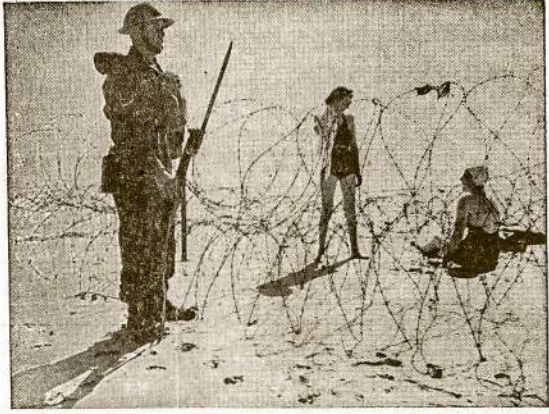
Šis paveikslas nutrauktas kur nors Anglijoje palei kanalą. Sako, ir karui siaučiant žmonės negali išsizadėti įprastų pasimagaravimų: dvi moteriškės maudosi saulės spinduliuose, o kareivis čionai savo kareiviškais pareigais. Veikiausiai sargybinis viešų milijonierų, — gi biedniokai suvartyti į sklepus.