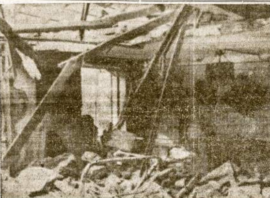
Šis paveikslas, kaip cenzoriai sako, parodo sugriautą namą Heidelbergė, Vokietijoj, kada ten paskraidė Anglijos orlaiviai. Kaip dabar karas eina, lygiai tuo patim atsimoka vienai kitiems.