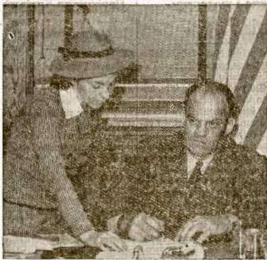
National Maritime Union (CIO) prezidentas Joseph Curran, pasirašo po peticija, kuri bus įteikta prezidentui Rooseveltui ir generaliam prokurorui Robert H. Jackson, reikalaujant paliuosuoti keturis tos unijos veikėjus, kurie kaltinami 6 metų senumo įstatymu, išleistu prieš didžiulius trustus. Jie kaltinami neva peržengę tą įstatymą.