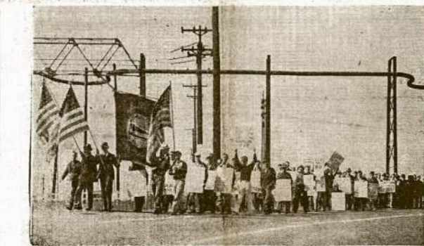
Bethlehem pleno korporacijos laivų statybos darbininkai masiniai pikietuoja šįjardį, Sparrows Point, N. J. Streikieriai priklauso prie CIO unijos.