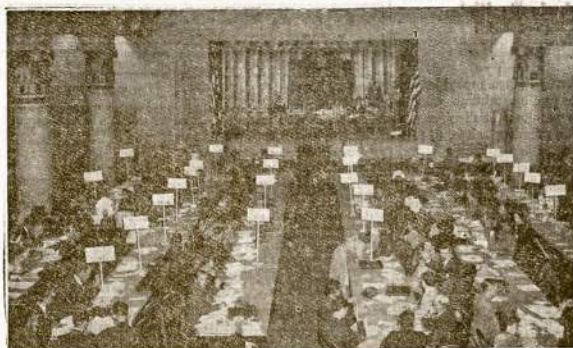
Šis paveikslas parodo pirmą konvenciją United Federal Workers (CIO), kuri įvyko Washington, rugpjūtį 17 dieną. Darbininkai turinti valdžios darbus, taipgi susiorganizavę į uniją, kuriai vadovauja CIO, ir jie, kaip visi darbininkai, kovoja ir budi savo reikalų apgynimui.

Sworn to and subscribed before me this 30th Day of Sept., 1940. ANNA M. KIRAS, Notary Public (My commission expires April 13, 1944.)