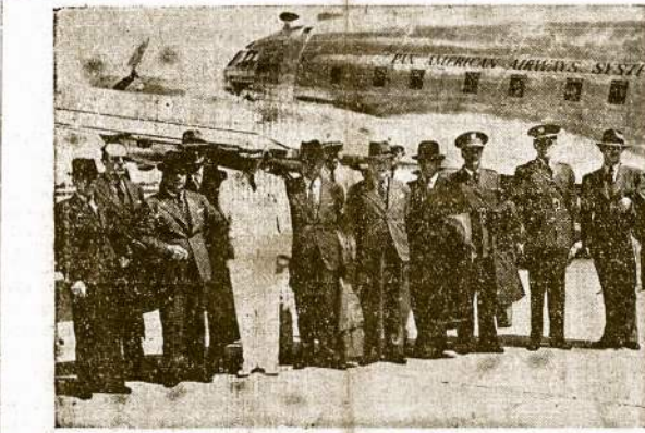
Pietų Amerikos respublikų armijų viršininkai svečiuojasi Jungtinėse Valstijose.