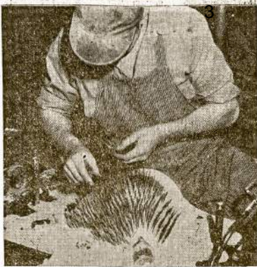
Tai darbininkas Wrgiht Corp. dirbtuvėje, Fairlawn, N. J. Šioje dirbtuvėje išdirbama valdžios užsakymai karinių pabūklų. Darbininkai kovoja, kad giletų susiorganizuoti į uniją. NLRB irgi tą patį pareiškė ir dar pagrūmojo, kad jei kompanija nepileis unijos, negaus valdžios užsakymu. Bet jinai vistiek gavo, ir kaip rekordai rodo, kompanija per 6 mėnesius padarė gryno pelno $6,235,969. Tai ve kodėl dirbtuvų magnatai nepileidžia darbininkams susiorganizuoti, kitip, bijo, sumazėtų pelnai, padidėtų darbininkų algos.