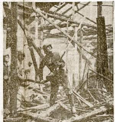
Berlyno gaisrininkai gelbsti anglų bombų uždegtus trobesius

Berne, Šveicarija. — Nors Lavalis viešai nesako, bet jo politikos kryptis rodo, kad sie- kiasi Prancūziją priversti prie karo su Anglija.