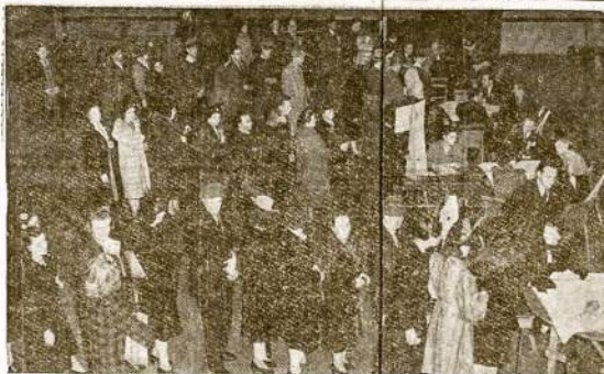
Leviton Manufacturing kompanijos darbininkai, New Yorke, balsuoja už CIO eniją. Pravedus balsavimus pasirodė, jog 1,299 darbininkai balsavo už CIO, o tik 70 prieš.

Tuli sako, kad tik Romos katalikų bažnyčia yra priešas progresu, o visos kitos krikščionybės sektos stovja už progresą. Tas netiesa. Protestonai, liute-