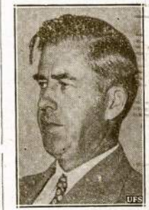
H. A. Wallace. — Naujas vice- prezidentas, iki šiol eings agri- kultūros sekretoriaus pareigas.