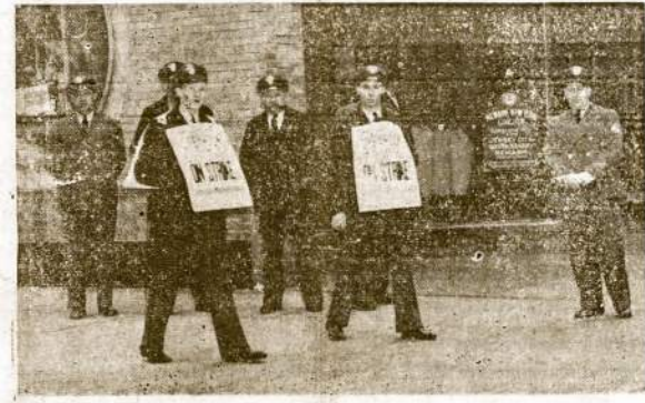
Grayaudn Busų Soferiai Streike

Už tai iš Bulgarijos reikalau- ja, sykiu su vokiečių ir italy ar- mijom, puliti Graikiją ir Turkyją.