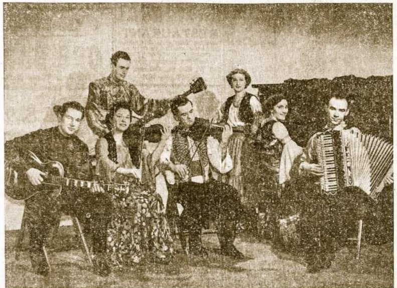
The Russian Gypsy Ensemble

Įžanga: iš anksto perkant tikieta 60c, prie durų 75c. Įsigykite tikietus dabar.