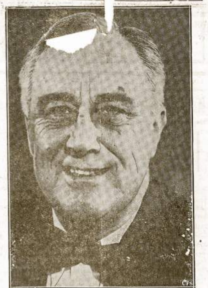
FRANKLIN DELANO ROOSEVELT išrinktas Jungtinių Valstijų prezidentu trečiam 4-ryū metų terminui. Tai pirmas tokis atsitikimas Amerikos istorijoj.

Labai dėkavojame už laiška, kurj gavome rugpjūčio 9 dieną. Pas mus naujienos tokios: Turime naują valdią, komisijone. Kaip bus prie jos, dar nežinome—geriau ar blogiau. Mums, kaip mažažemiams, gal nieku. Bet bagocijai, tai baigia išdukti. Mat, niekam nepalieka daugias žemės kaip po 30 hektarų. Kas turėjo daugiau, nuo ty ūtima ir atiduoda bežemiams