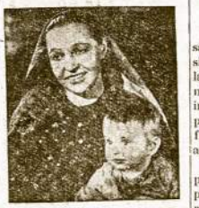
Scena is Judžio "Did. Pradžia"