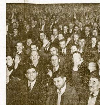
Aluminium kompanijos darbininkai, New Kensington, Pa., bahuoja tšsi streiką iki kompanija išpildys unijos reikalavimą. Streikuoja 7.000 darbininkų. Buvo atvykęs ir CIO prezidentas Philip Murray teirautis apie streiką.

Buenos Aires, Arg., lapkr. 28. Argentinos ir Ispanijos vyriausybės padarė prekybinę sutartį, apimančią $4.158,000. Ispanija pirkis 350,000 tonų kukuruzų iš Argentinos, o šis pirkis pilno ir kitų produktų savo gėlėjimams. (Ispanija pati neturi per daug produktų; gal tikisi iš Vokietijos gauti).