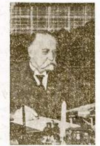
Kyosti Kallio, Suomijos prezidentas, kuris rezignavęs, sako, dėlė silpnos sveikatos. Manoma, kad jo vietą užims Risto Ryti. Reakcinis elementas nori barono Mannerheimo prezidentu, bet jiem priešingą pažangesnis elementas.