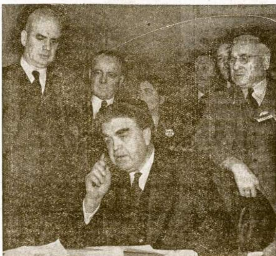
Užlaiga CIO konvencijos Atlantic City, N. J. Šioje konvencijoje nebeapsiėmė kandidatuoti prezidento urėdai John L. Lewis; Jo vieton išrinktas Philip Murray. Atvaizdė matosi keli CIO Pildomosios Tarybos nariai.

Šis sausų stėpių rajonas, kur pirmiau buvo džiugiamasis gamybos 30-40 pūdų derliaus iš hek-