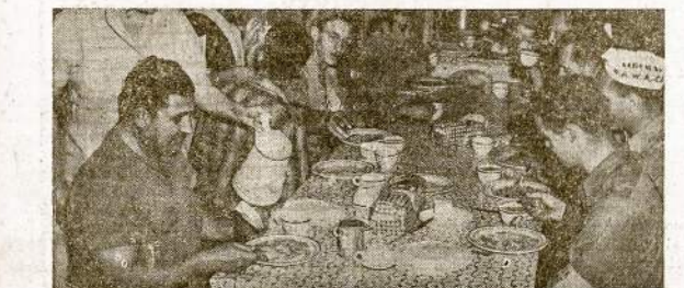
Vultee lėktuvų įmonės streikieriai valgo pietus, kuriuos jiems pateikė CIO unijos pagalbinė moterų organizacija. Streikas jau pasibaigė dideliu darbininkų laimėjimu, nors reikacija laisvai šėlo prieš streikierius.