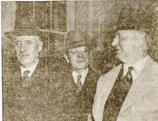
"Darbininkų" atstovas su didžiaisiais tuzais Washington'e kalbasi kaip sulauktyti darbininkus nuo streikavimo, kada kitose šalyse einant karui amunicijos ir ginklų fabrikantai nebesėja žertis pinigais. Ka tik išėjo iš "baltojo namo" po pasitarimo su Rooseveltu stovi, skaitant iš kairės: karū ministeris Henry Stinson, "darbininkų" atstovas Šalies Saugumo Komisijoj Sidney Hillman ir laivyno ministeris Frank Knox.

Stiklas, Užleidžiamos Garadijiam Dury. Mašina, Ir Visokis Darbas prie Namu, kaip iš Lauko, taip Vidaus. Naujos Mados Brick-Sliding Išmokėjimai per F. H. A. Paskolas. Gaukite mūsų žemas kainas ir ap skaičiavimą pirm pirkiant.