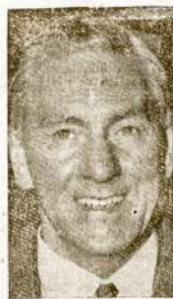
"Darbininkų atstovas" (su šilkinėmis kelnaitėmis) Sir Walter Gilrine, kuris atvyko Amerikon su speciale misija patraukti šios šalies valdančiąją klasę gelbėti Anglijos imperiją.

Teniniai.—Tauragės apskr. Tenenių bažnk. su plačia apielinkė yra tolimas užkampis. Todėl čia būtinai yra reikalinga suaugusiems didesnė biblioteka ir skaitykla, nes jūmimas ilgais žiemos vakarais, neturėdamas ką veikti, pradeda kortuoti. Knygynū-skaitykla yra ir tinkamas patalpos. Teniškis.