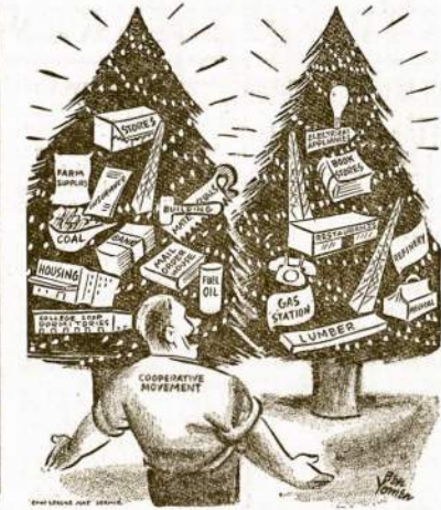
Priklausančių kooperatyvuose narių "kalėdų eglaitės". Visa bėda, kad smulkiesiems kooperatyvams neįmanoma pasekminga konkurencija su stambiaisais trustais.