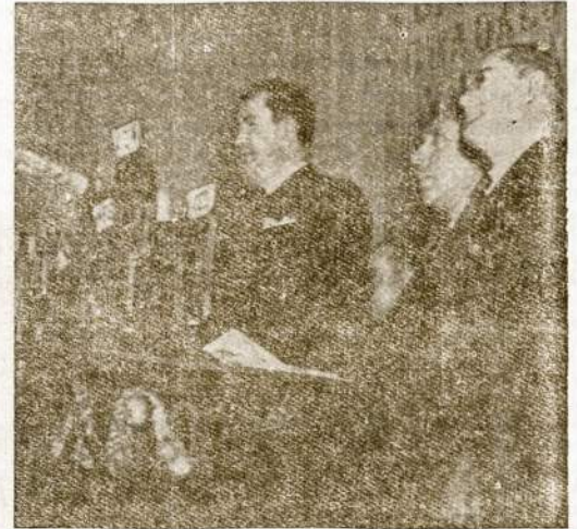
Naujojo Meksikos prezidento Manuel Avila Camacho inauguracija. Kaip prieš naująjį prezidentą, taip ir prieš Amerikos atstovą Wallace Meksikos fasistai buvo iškėlę demonstracijas.

Drauge! Ar jau gavai naują skaitytęją "Vilniai"?