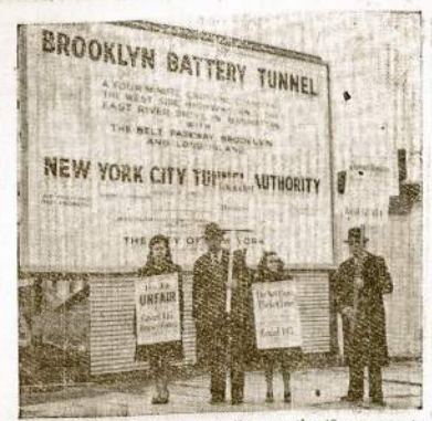
Kas sakė, kad jaunoji Amerikos gentkarfė nesupranta darbininkų reikalų ir nenori kovoti už geresnę buklę? Štai New Yorko tunelį kasėjai išėjus į streiką už žmonišknes sąlygas jų vaikai pikietuoja imonę kartu su tėvais.

Nors mes tur sričių veikėjų darbus ir laikraščius turinūs nevertinam kaip naudingais, bet mes kaip savo lautos žmoniūs ir laikraščiams "Keleivis", "Dirva" ir "Lietuvių Žinios" linkime visog ger ir su pradžią šių Naujų Metų jų vairo pakrėpimo, kad tarnautų darbininkų klesai. Tuomet mes seneliai ir visa pažangoji darbininkiška visuomenė įvertins jės darbus ir jų laikraščių turinūs ir džiaugsis, kad ne kapitalistine darbininkų išnaudojimo sistema simpatizuoja, bet darbininkų judėjimo rėmėja ir mūsų vedėja jų, nauja je išnaudojimo, je kary, be varų je be skurdo darbininkų gyvenimū.