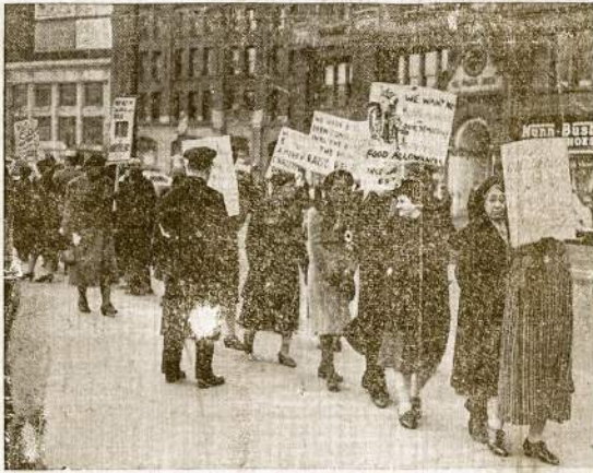
BEDARBIAI PIKIETUOJA NEW YORKE MIESTE ROTUSE. Amunicijos fabrikai eina visais garais, kuomet Europoj ir Afrikoj miestai ruksta dumais iš prielasticios karo. Bet Amerikoj bedarbė vistiek neišnyko, kaip matote iš šios demonstracijos.