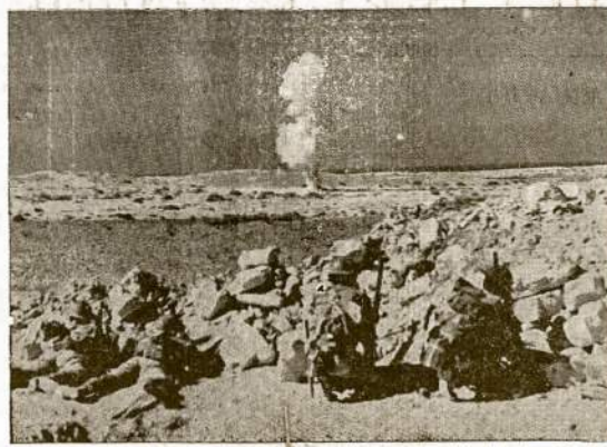
"Ramybė ant žemės geros valios žmonėms..." Štai kaip pildosi "arkangelo Gabrieliaus apreiškimas". Šis paveikslas nutrauktas netoli tos vietos, kur, sulyg žmonių padavimais, gimė "taikos karalius"—Egypcie. Vietoj taikos ir ramybės, šias kalėdas Egipte žemė drebojo nuo bombų ir kanučių šuvių. Pačiam Betteleiaus miestelyi buvo girdėtis einamo karo garsai.

Iš Komjaunimo CK buvo pranešta, kad pagul pareikalavimo iš Lapių valstiaus tie vaikai sekmandieno ryto 7 val. turėjė buti paimiti to valstiaus atsiustu automunkeivčiumi. 7 val. 30 min. važiuoja pro šalį sunkvežimius, kurj cukrinių runkelių kasimo entuziastai savanoriai sustabdo, bet paniškėja, kad ši mašina turi nuvežti į Gar-