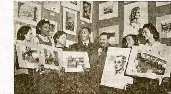
Siuvėjai-artistai. Neseniai New York'e išstatyta paroda piešiniai, gaminti siuvėjų unijos 22 lokato narių. Daugelis šių piešinių tikrai artistiški atlikti ir nustechno geriausius piešimo meno žinovus. Ties savo piešiniais čia matome stovint ir jų autorius.

Kitas stebuklas buvo tokis: Sykį Mohametai priešai užnuodijo jo maistą. Kada jis sėdės valgyti, tai užnuodytas kumpis prabilo įspėdamas Mohametai apie pasikėsimą ant jo gyvastes. Suprantama, jei tų stebuklų sumanytojai būtų žinoję, kaip didelis mėnulis, jie nebūtų sakę, kad pusė jo išlindo per Mohametai rankove.