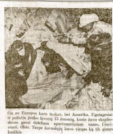
Čia ne Europos karo laukas, bet Amerika. Ugniagesiai ir polietija įješko lauvonį 13 metų, kurie žuvo eksplozivus gusus dideliame apmintiniam name, Cincinnati, Ohio. Tarpe žuvusiųjų buvo vienas kas tik gimęs kudiak.

rekortais. Nerūdę suareštavimo ant rekordų, je aplikantūi duoda certifikatą.