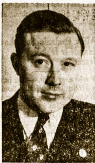
Walter P. Reuter, automobilių unijos organizatorius General Motors divizijoj. Jis šiom dienom valdžiai pasiulė planą kaip paskubinti lėktuvų gamybą. Sakko, planą dabar studijuoja pats prez. Rooseveltas.

Toliau aš turiu progos pamatyti ir fašistinę Italiją: Italijos laivas mane veža prie Palestinos kranto. Krašto biednystė ir atsilikimas mane labai paveikia. Aš greit apsirpantu su krašto sąlygomis—karštai žengiu kovon už geresnį darbininkų masių gyvenimą, kurios begėdiškai eksploduojamos Anglijos imperializmo; vedama kova už išsiliuosavimą iš po Anglijos jungo. Tuomet laikraščiai atneša žinią, kad Ispanijoj įvyko fašistų sukilimas. Nežūrint to, kad Palestinos krašte vedama ginkluota kova, susidomėjimas Ispanijos įvykiais labai didelis. Su nepaprastu įtempimu skaitomos naujienos iš Ispanijos. Aš nutariau kuo greičiau išvažuoti