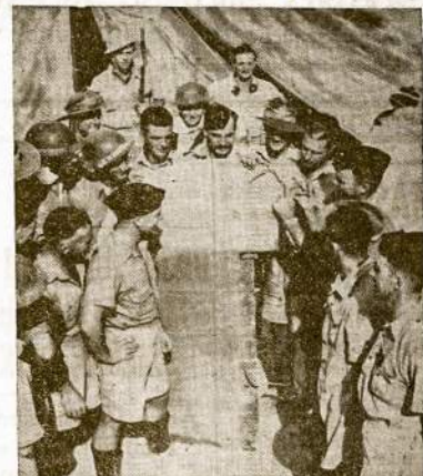
"Atminčiai Karo". Taip kalli aiš Australijos kare-iviai, radę šmotį Italijos lėktuvo Afrikos tyruose.

Kas liečia Sovietų Sąjungą, tai iš įsitikins, jog didesnę da-lį šio klio į socialistinę demokra-tiją jau nužengta. Juk tai fak-tas, jog gamybos priemonės pri-klauso liaudžiai, o ne pavieniam asmeniui, taigi faktas ir tai, jog tuo laiku, kai demokratinės ša-lis savo plepalais apie nusigin-klavimą ir nuolatinėmis nuoli-bomis suteikė fašistinėms ša-lims galimybės stiprėti, viena tik Sovietų Sąjunga, dėka savo pla-