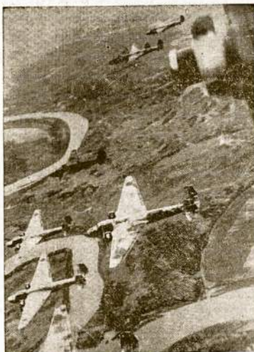
MIRTIES PAUKŠČIAI KINUJOJE. Tai japonų kariniai bombonešiai, kurie dažnai bombarduoja laikinąją Kinijos sostinę Chungkingą. Kaip ir kitose „civilizuotose“ šalyse, japonai daugiausia žudo miestų gyventojus, kūdikius ir senelius, nes dalartiniams karuose apkasų jau nebėra.