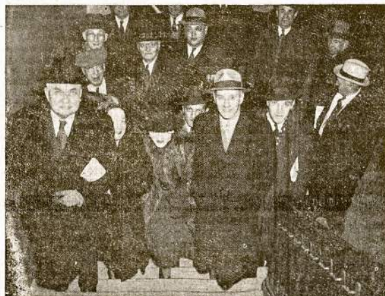
Kai Chicago miesto valdininkai aną dieną turėjo „puskuoti“ pėsti kelis aukštus, į darbo vietas. Tai buvo tą dieną, kai keltuvų operatoriai ir kiti miesto mechanikai buvo paskelbę streiką prieš numušimą atgų. Streikas sutaliktas nepilnu darbininkų laimėjimu.

J. LIULEVIČIUS 4348 SO. CALIFORNIA AVENUE TELEPHONE: LAFAYETTE 3572