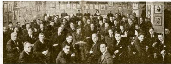
CIO VYKDOMOSIOS TARYBOS posėdis Washingtone, nustatymui unijų veikimo, taipgi ir išdirbimui legislatyvio programo 1941 metams.

Tuo straipsniu Fordas numaskuojamas galutinai. Straipsnio autorius Dan Gillmor, "Friday" leidėjas. L. Pruseika.