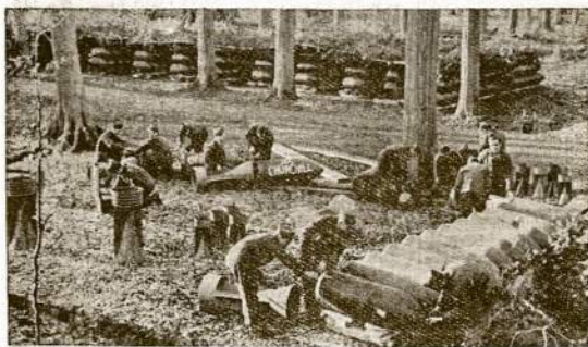
Vienos nakties "civilizacijos" darbas. Italų propagandos ministerija prie šio atvaizdo aiškina, jog tai esą juodmarškiniai pasirengę pulsti Angliją iš oro. Kaip jiems tas sekasi, visiems jau žinomas "sekretas".