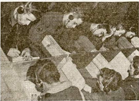
Valstijų milicininkai jau federalėj kariuomenėj. Čia matosi burys milicininkų bestu- dijuoją radio komunikacijos techniką. Tai yra dalis jų karinio mušto.