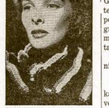
KATHERINE HEPBURN, garsioji aktorė ir judėjų žvaigždė, baisiai nekėnia skėby. Aną dieną ji vaidino rolę dramoje "The Philadelphia Story", Evansville, Ind. Pastebėjusi, kad prie viešbučio McCurdy vaikšto pikietiškiniai, ji kuogreičiausia iš jo išiskraustė parkeikšdama: "Aš priklausau anoj pusėj tvoros".

Morkų Sunkienė.—Užvirinti vandens apie 2 litrus, įdėti 3-4 nusukutas morkas, truputį cinamono žievės, kelis gvazdikėlius ir citrinos ar apelsinos žie-