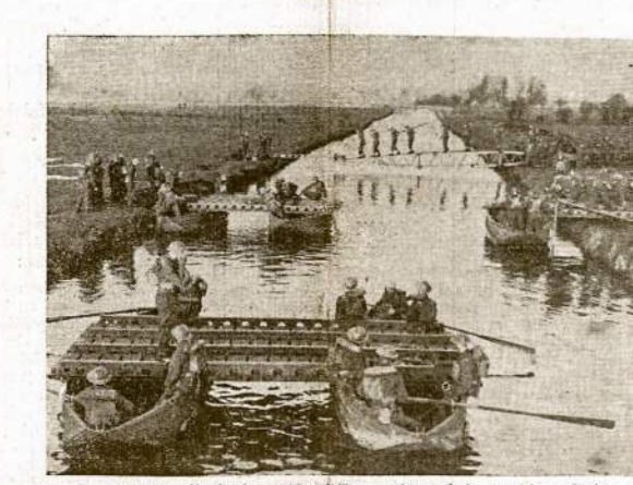
Jungtinių Valstijų kariuomenė atlieka pratimus, kaip pereiti vandenis.