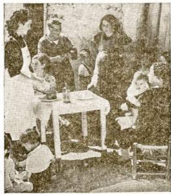
Fašistai mokina Ispanijos šeiminkines kaip apsiesti su mažiau maisto, drabužių ir kitko. "Falangos" (isp. fanų fašistų organizacija) narė, su haltu žiurste, aiškina moterim, kad prie fašistinės tvarkos kitaip ir negali būti kaip tik... susivėręti diržus.