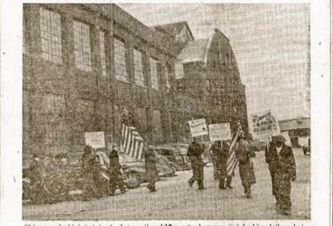
Chicago darbininkai įrodė International Harvester korporacijai, kad jau laikas skaitytis ir su darbininkais kaip su žmonėmis. Kai kompanija atsisakė tarti del algų ir sąlygų traktorių skyrių, darbininkai visu 100 mokėmėjų išėjo į streiką ir šiandien dirbtuvė stovi uždaryta, o ties vartais matome streikičius pikietuojant.