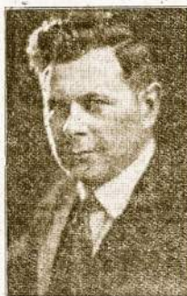
POVILAS STOGIS žymusis lietuvis Basas.