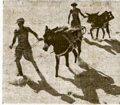
Tai esą Anglijos kariai asilais "mechanizuoti" vežasi Italus Libyjoj, Afrikos šiaurėje.

New Yorkas. — Išnuomavo amerikiečių kelevinį laivą "Rescue Ship Mission," gabenimui ispanų respublikiečių iš Francuzijos nuolatiniui apsigyvenimui į Meksiką.