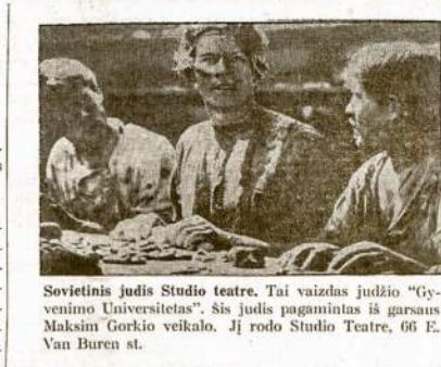
Sovietinis judis Studio teatre. Tai vaizdas judžio "Gy- venimo Universitetas". Šis judis pagamintas iš Garsaus Maksim Gorkio veikalų. Jį rodo Studio Theatre, 66 E. Van Buren st.

"Chicago Tribune" šeštadienį pasirodė aprašymai, kad buvusį kompanijų unijų perditinai laikus susirinkimus ir perėina į ADF skrynius. Jeigu tas teisybė ir jeigu ADF viršininkai tokius žingsnius daro, tai lik parodys, kaip jie tarnauja fabrikantam ir kenkia darbininkams susiorganizuoti. Streikietyrs.