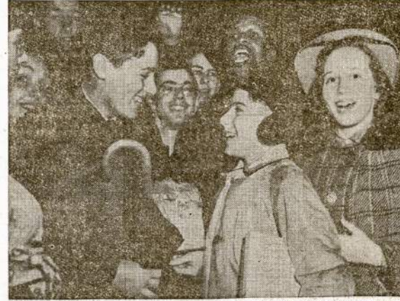
Dalis delegacijos Amerikos Jaunimo Kongreso Washingtonė. Apie 5,000 Amerikos jaunuočių šiomi dienom atlaikė suvažiavimą šalies sostinėje ir įteikė perspėjimų valdžiai neįtraukti J. V. į europinį karą.