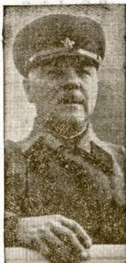
Klementij Jefremovič Vorosilovas

Tais pat metais Vorosilovas prisirašė į Rusijos Socialdemokratų Darbo Partiją ir visa energija metėsi darban už išlaisvinimą visos Rusijos liaudies. Smarkiausias darbininkų