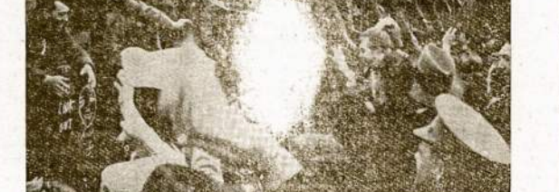
Australijos jaunuoliai išvažiuoja j karo frontą guldyti kur nors už tukstančių mylių galvas nuo tėvikiš ir savškių. Mat, Australija vis dar tebėra Britanijos kolonija ir delto privalo ginti imperijos' interesus.

Plintant ir tobulėjant iriga- cijos tinklų, vis toliau atsi- traukia dykuma, užleisdama vietą medvilnės plantacijoms, ryžių ir kitoms šilumą mėg- stantioms kultūroms. Bet jei dyki plotai su girių, smėlio ir molio žeme irigacijos dėka pasidaro dirbamais ir žydin- čiais laukais, tai smėlynų dy- kumos, kaip taisyklė, žemės ūkiui netinka. Smėlynams už- valdyti jį pagalbą atėjo moks- las." (Tęsa ant 4-to pusl.)