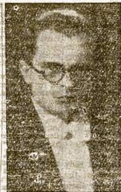
VYTAUTAS BACEVICIUS Soviet Lithuanian Pianist

BACEVICIUS' piano compositions are published in Vienna, Universal-Edition, and in Paris, Edition Heugel, Au Menestrel. His widely known orchestra compositions are as follows: two Symphonies—the second, "Simfonia de la Guerra" (War Symphony) was written in Buenos Aires; Symphony Poema (188 instruments); an opera "Vaidilute" (three acts, seven scenes); a ballet "Tourmonte de la Vie"; Waltz Ballet, Overture, Suite; "Poeme Electrique"; two piano Concertos and seven modern compositions for the organ, including two Lithuanian songs.