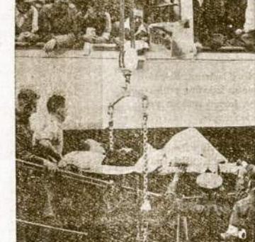
Skaitant laikraščius atrodę, jog anglai vien tik: ilalus musa Afrikoje, patys nieko nuneukėndinti. Bel su šiuo atvaizdu patrys britų valdniekai duoda paškikimą, jog tai padaroma kaip išganymas anglai suštiejęsi iš Afrikos musio lauko.