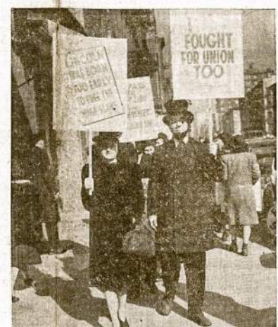
"LINCOLNAS MARSUOJA" New Yorko gatve piketuodamas Sonneborn Sons, Inc. kompanijos ofisus, kur, United Office and Professional Workers unija paskelbė streiką. Lincoln gimimo dienoj streikiariai panaudojo progą—vienas jų apsisaitė Lincolnu. Juk ir Lincolnas stojo už unij—dėl palaikymo valstijų visas jėgas dėjo.

Berlynas. — Pranešimai sako, kad vokiečių lakūnai bombarduoja Malta saloj Anglijos bazes.