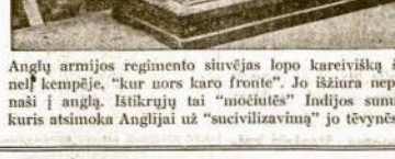
Angly armijos regimento siuvėjas lopo kareiviška šinėlė kempinė. "Kur nors karo fronte". Jo išdūs nepašė į anglų. Ištikrujū tai "mučiotės" indijūs sužems, kuris atsikomo Anglijai už "suciivilizavimą" jo tėvynės.