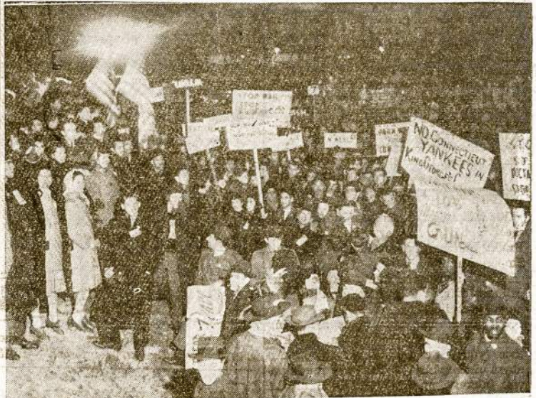
In the shadow of the Washington monument, young people from all parts of the United States gathered at the nations capital to voice their protest against war on February 7-9.