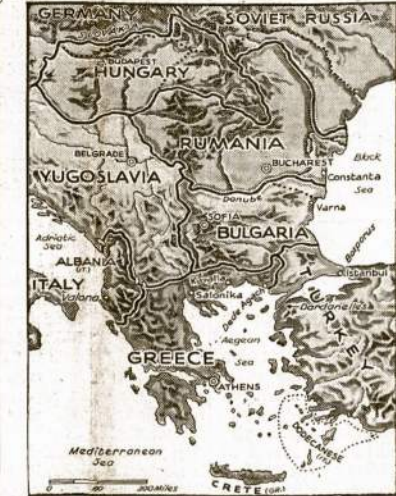
BALKANAI, kur dabar veiks viso svieto akys nukreipta, nes čia tikimasi naujo karo fronto įsiveržimo, o jei ne, tai kiti kokių permaining, būtent, Graikijos susitaikymo su Italija. Vokiečiai jau perėjo Vengriją ir Rumaniją iki Bulgarijos ir Jugoslavijos rubežij. Kas toliau?

Visos istaigos laike apvaikčiojimo uždaryta, išskyrus cukrui ir žmones.