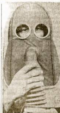
"Vėliausios mados".— tiesiai iš Europos karo lauko! Šias ant-dujines maskas dėvi Anglijoje tik tie, kurie paprastų maskų dėlei menkos sveikatos negali dėvėti.

Ottawa, — Belgijos Kongras nori prekybos susitarimo su Kanada.