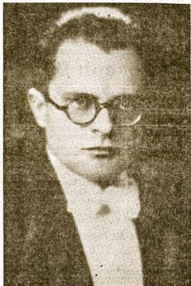
Prof. Vytautas Bacevičius