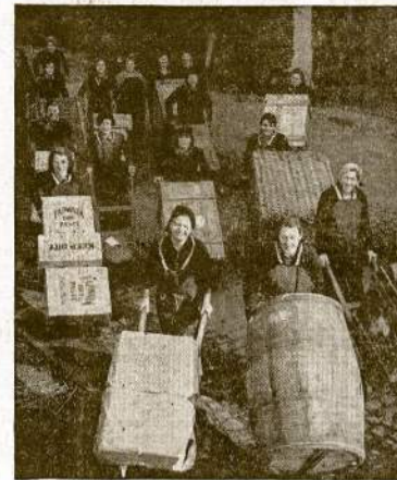
Anglijos moterys dirba gelžkelio stolyse ir prieplaukose. Paveikslas rodo moteris vežant statines ir dėzes gelžkelio stolyse. Vyrų sumti į armiją, tai moterys turi atlikti ir sunkiausius darbus.

Londonas.—Angly aviacija bombardavus Loriantą, okupuotos Francijozijos portą. Jis bombarduota jau trečiu kartą.