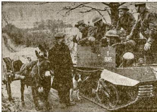
Airija nekariauja, bet panašūs vaizdai jos laukuose kasdien matomi. Čia atvaizduojamas farmers kelyje į turgų, o jo kaimynas pasiruošęs militari manevram.