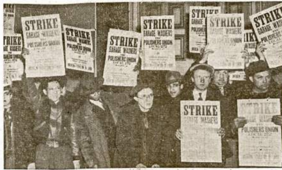
Garų darbininkai New Yorke paskelbė streiką pasiruose piktietimui. Viso streikavo 8,500 darbininkų 960 to miesto garų. Jie reikalauja daugiau mokesnio.

Washingtonas. — Valdžia sa- ko ims nagan maisto spekulian- tus, kurie pasinaudoję padėtimi lupa nepaskomai aukštas kai- nas ant maisto.