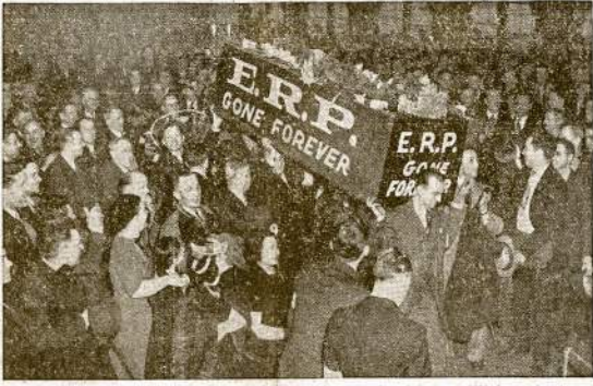
LINKSMOS LAIDOTUVES! Tikrai šiose "laidotuvėse" niekas neišlejo nei vienos asaros. Tai Bethlehem plieno fabriko darbininkai, Johnstown, Pa., "laidoja" kompanišką uniją — "Employees Representation Plan."