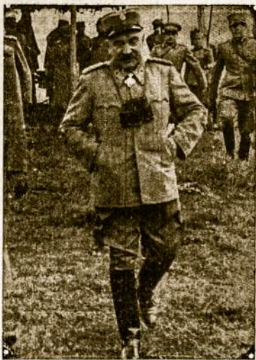
Naujasis Jugoslavijos premieras gen. Dusan Simovič. Jis aną dieną pravedė sukilimą ir pasekmingai nuvertė buvusį Jugoslavijos vyriausybę, kuri kaitė buvo pasirašiusi "draugiškumo sutartį" su Hitleriu.