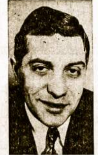
VITO MARCANTONIO pažangusis kongresmanas iš New Yorko valstijos. Už jo pastangas grynime atėvųjų teisių kongrese, jis neseniai viešai pagerbtas Atėvių Teisių Gynimo komiteto suvažiavime, Atlantic City.

Kada kongrese buvo debatuojamas klausimas Paškolos ir Randavimo Biļiaus, pažangusis kongresmanas, iš New Yorko valstijos, pasakė žemiau sekančią prakalbą. Amerikinė spauda užtylėjo apie šią prakalbą. Skaitytojam čia pateikiame tik dalį tos istorinės kalbos.—Red.