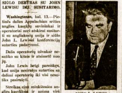
JOHN L. LEWIS.

Sanchai, bal. 13. — Anglijos militarinė misija nuvykus iš Singapuro į Hanoi, Indo Kinijon, tartis su francūzų koloniale valdžia. Japonai reiskia baimės, kad angliai bandysį pasikalbinti Indo-Kiniją savo pusem.